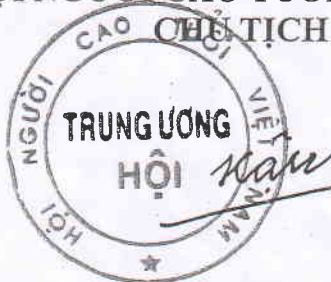
Cù Thị Hậu